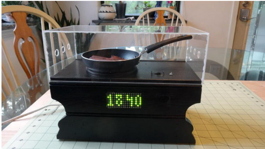
圖二：〈培根鬧鐘〉（Bacon Alarm Clock）。