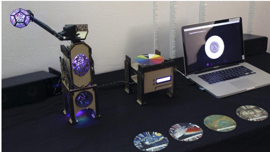
圖四：〈經驗轉換器〉展出設置，文化實驗室第七空間，新堡大學。