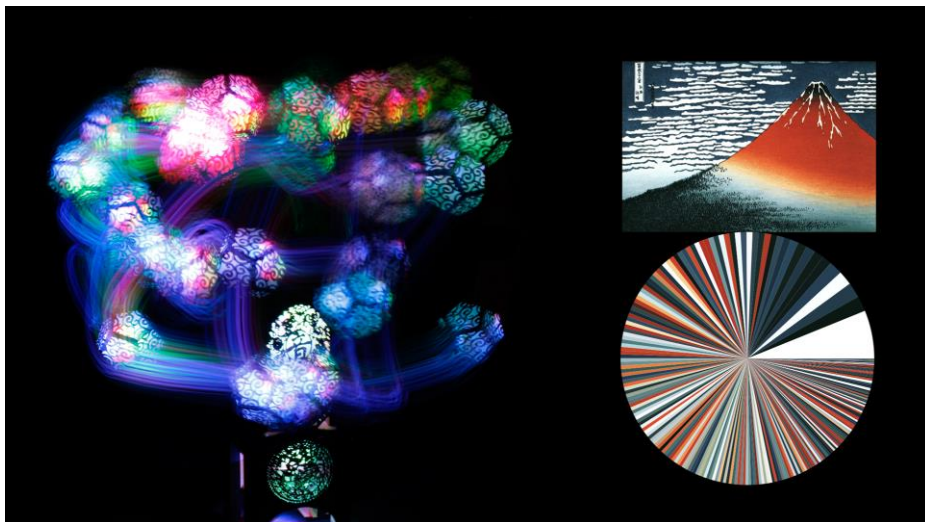
圖五：〈經驗轉換器〉影像—色盤—動態軌跡對應圖。左方影像以延遲曝光拍攝。