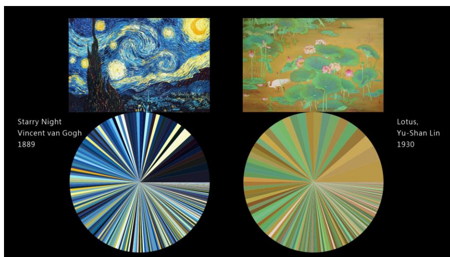
圖三：Processing 程式將影像轉換為色盤的前後對照圖。

在此開放社群的開發過程中，作者得到許多意料未及的收穫。例如在實驗以前，作者對上述技術並不熟悉。因此〈經驗轉換器〉的開發，可被視為開放社群導引作者思考「技術問題」，並逐步走向「實體化」的過程。社群參與者對於〈經驗轉換器〉技術上的建議，例如色彩感測器的誤差值、測量色彩的最短時間間距、PureData 轉換數據技巧等，都影響了作品的開發方向。而在概念上，從最初預想的核心技術「色音轉換」開始，〈經驗轉換器〉之概念受到社群影響，延伸為產生多種經驗相互轉換的可能性，而發展出更接近古典音樂盒般的表演設置。